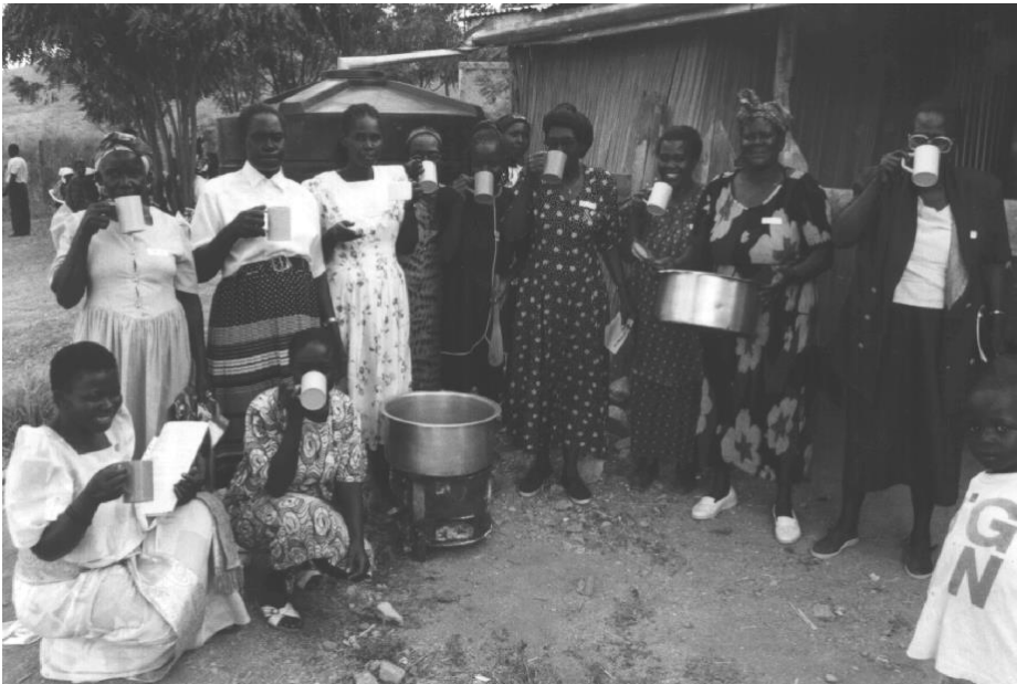
Participantes en un seminario de Anamed toman té de pulsiana en el proyecto de Kibisom, en la Isla Rusinga, Kenya.

El propolio es un producto de las abejas y ha demostrado tener propiedades antibióticas, antihongos, antisépticas y antivirales. De cualquier modo, hasta esta etapa, no conocemos de una buena receta y agradeceríamos comentarios de personas que hayan usado una o ambas sustancias.